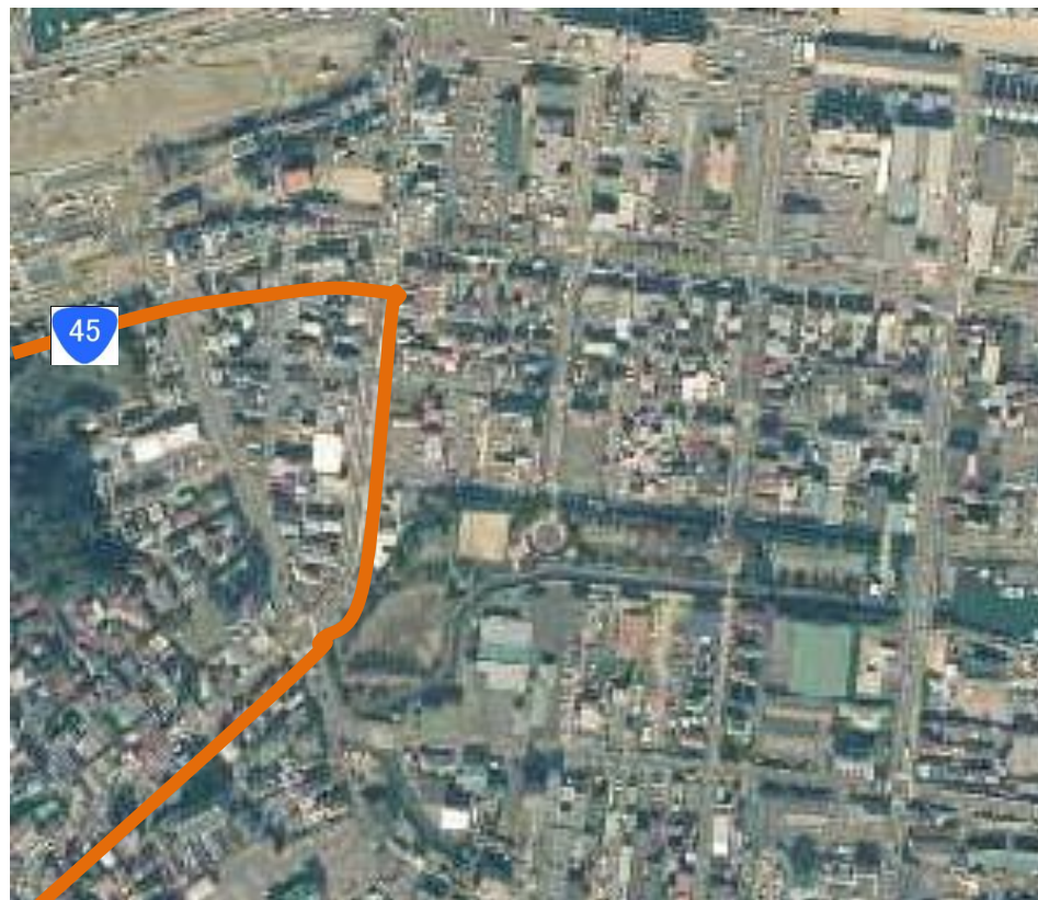
被災後(平成23年3月12日撮影) (国道の冠水)